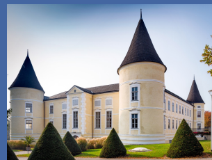
Festsaal des Schloss Weinzierl