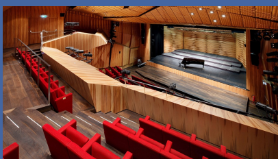
MuTh – Konzertsaal der Wiener Sängerknaben