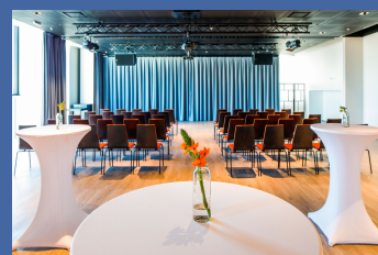
Lighthouse 10 – Haus des Meeres